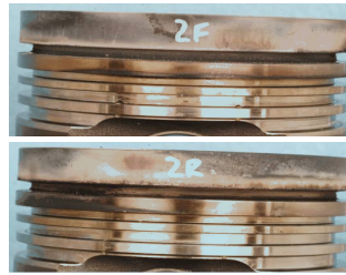
Минимальные отложения на поршнях по результатам 500-часового специального испытания масла Cat DEO-ULS на выносливость